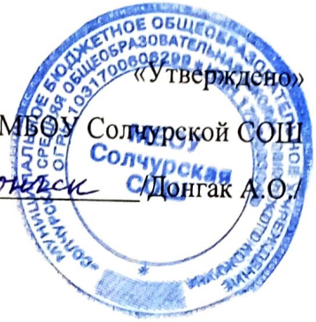
ГРАФИК ДЕЗИНФЕКЦИЙ ПОМЕЩЕНИЯ ВО ВРЕМЯ ПРОВЕДЕНИЯ НОВОГОДНИХ УТРЕННИКОВ